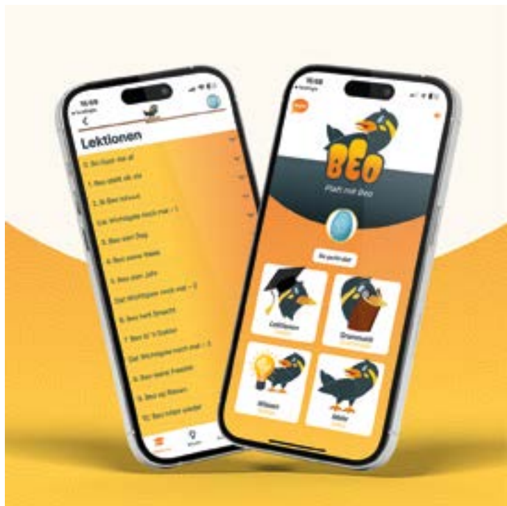
Grafiken: Ein pfiffiger Beo begleitet die Plattdeutsch-Lernenden © Marktplatz GmbH Agentur für Web & App

(PM) Gute Nachrichten für alle, die zwar schon „Moin“ sagen können, aber gern noch mehr Niederdeutsch lernen möchten. Ab sofort lässt sich mit einem sympathischen Vogel zur Seite von Grund auf Platt lernen. Im Google Play Store und im App Store (iOS) steht dazu „Platt mit BEO“ zur Verfügung – die audiovisuelle Sprachlern-App zum kostenfreien Download für alle mobilen Geräte.