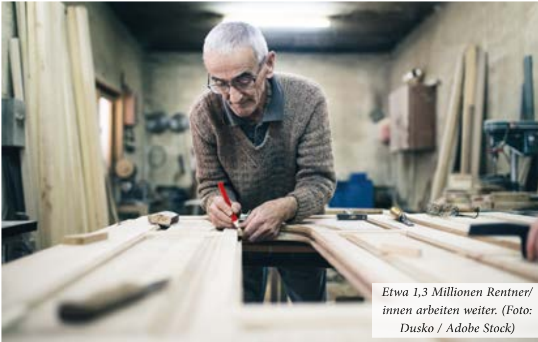
Etwa 1,3 Millionen Rentner/innen arbeiten weiter.

schließlich finanzielle Gründe. Fachkräftemangel spielt etwa hier auch eine große Rolle. Und wenn man dann noch mit viel Freude seinem Job nachgeht, ist das sicher auch nicht zu beanstanden.