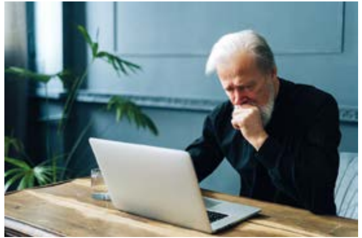
Nicht nur ältere Menschen sind für Online-Dienste unzureichend an Endgeräten ausgestattet oder fühlen sich dafür nicht fit genug.

Ältere Menschen nutzen digitale Möglichkeiten oft nicht, weil sie nicht über die entsprechenden Kompetenzen verfügen. Die BAGSO