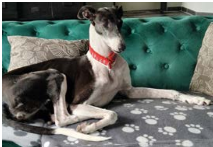
Laelynn genießt ihren Platz auf dem gemütlichen Sofa und die gemeinsamen Kuschelstunden.

Eine vorherige Terminabsprache ist erforderlich. Telefon: 0541/501-9499. E-Mail: SPN@Lkos.de.