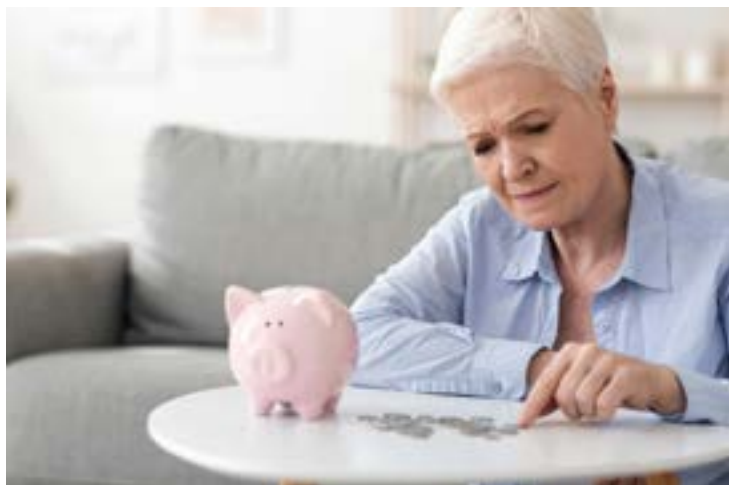
Oft genug müssen Rentner jeden Euro zweimal herumdrehen.

Dank stark gestiegener Preise bleibt noch weniger von der oft knappen Rente übrig