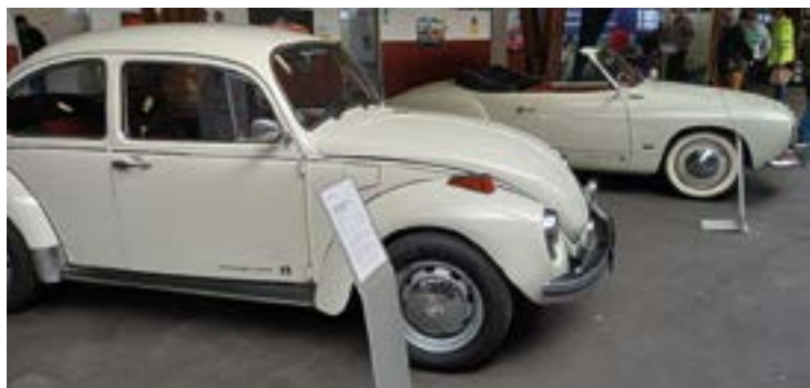
Fast schon legendär: der VW-Käfer und der Karmann-GHIA-Cabrio

(PM/BJ) Wer erinnert sich nicht gern an seine ersten Autos und an die Spritztouren, die man gemeinsam mit seinen Freunden unternommen hat? Noch mit Revolverschaltung und wenig Luxus - der Renault R4, das war mein erstes "Vehikel", gefolgt vom Opel Kadett B mit "LKW-Lenkrad" und in weiß gerollter Optik. Geliebt wurden sie beide. Heute findet man kaum noch Exemplare auf unseren Straßen, zählen sie doch mittlerweile zu den Oldtimern.