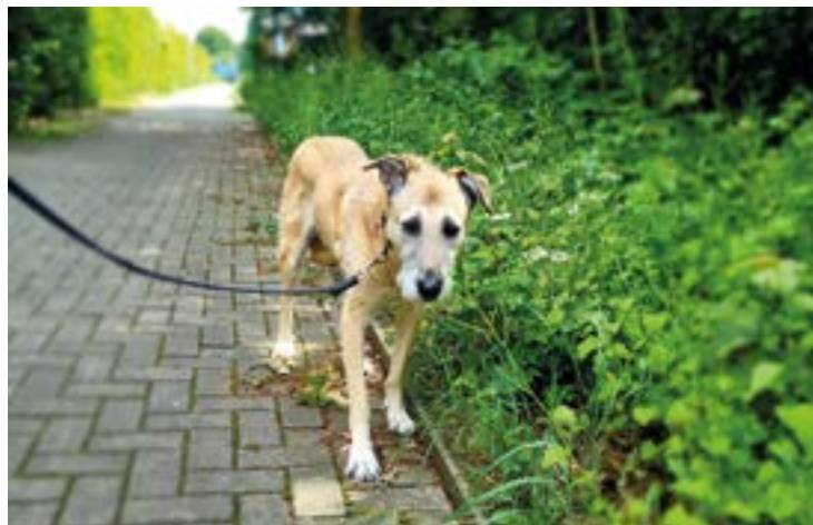
Ylvi zog im Alter von sechs Jahren bei mir ein und war mir fast acht Jahre eine treue und liebe Begleiterin.

Bevor ich mich auf den Weg zum Hundeschutzhof des Podencorosa begab, habe ich die Website nach geeigneten Kandidaten durchforstet und eine kleine Auswahl von Hunden zusammengestellt, die ich auf jeden Fall kennenlernen wollte - und das ist wichtig! Nicht die Optik zählt! Und so stellte sich sehr schnell heraus, dass Laelynn, die sechsjährige Galga, zu mir passen könnte. Sie zog dann kurz vor Weihnachten bei mir ein. Und sie ist der perfekte Beweis, dass